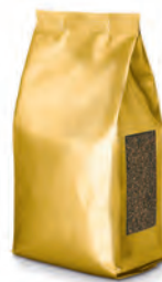
Beutel | Sachets Viele unterschiedliche Folien und Druckoptionen 15 g – 500 g