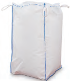
Big Bag mit Inliner 330 kg | 450 kg pro Palette FTL: 26 Paletten 20' FCL: 10 Paletten | 40' FCL: 22 Paletten