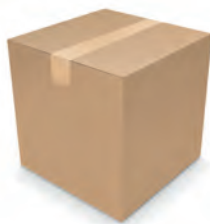
Kartons mit versiegeltem Polybeutel | 25 kg 450 kg pro Palette FTL: 26 Paletten 20' FCL: 10 Paletten | 40' FCL: 22 Paletten