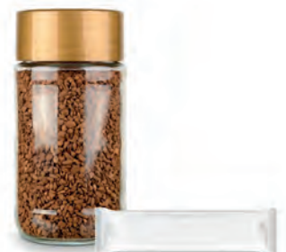
Co-Packing-Lösungen Gläser | Sticks | Doy Packs | Dosen